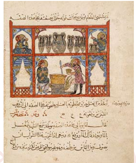
Illustration tirée d'une traduction arabe de la Materia Medica de Dioscoride

Samedi et dimanche 8-9 mai 2010 de 10h00 à 18h00 à l'Ifpo, Abou Roumaneh, Damas