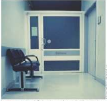
Les soins psychiatriques d'été, comme que les soins psychiatriques traditionnels, les placements sont dans un hôpital psychiatrique ou les traitements spécifiques ?

فهل سيتمكن الدليل الخامس بشكل أفضل من الموسوعات السابقة من تجنب إدخال إلى المستشفى لا لزوم له ومن تشخيصات غير مجدية؟